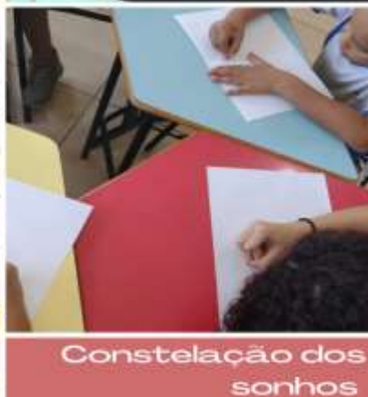
Constelação dos sonhos